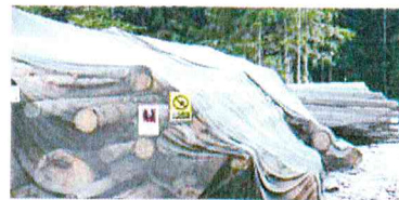
Ochrana skládek pomocí insekticidních sítí.

Asanační metoda odvozem napadeného dříví z lesa byla zavedena v 80. letech, kdy následovalo v průběhu několika dní zpracování, jehož součástí bylo většinou i odkornění. V nedávné době byla tato metoda „modifikována“ na odvoz za hranice lesa, kde lýkožrout dokončil svůj vývoj a „vrátil se“ do lesa, kde napadl další stromy. Toto je proto v současné době zakázáno. Aktivní kůrovcové dříví musí být asanováno!