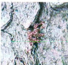
Drinky na patě stromu.

Včasná asanace napadených stromů s využitím všech dostupných metod zabrání nebo omezí napadení dalších stromů a tím se vynaložené náklady vrátí. Je nutné brát v potaz omezení jednotlivých metod a zohlednit je pro konkrétní situaci.