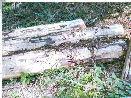
Asanace pomocí odkornění.

Ruční odkorňování je velice účinné (nelze jej ale použít ve stádiu žlutého brouka s výjimkou odkorňovacích adaptérů na motorovou pilu). Oloupání kůry z pokáceného kmene v malém množství nevyžaduje pro fyzicky zdatného vlastníka zásadní náklady, kromě investice do vlastního času a často je pro drobného vlastníka lesů jedinou dostupnou metodou. Chemická asanace nemá z hlediska vývojového stádia omezení, výkon je vyšší, ale pro drobného majitele lesa existují omezení v zajištění přípravků pro chemickou asanaci. Alternativou je odkorňování pomocí adapterů na motorovou pilu, ale je třeba vlastní pilu s odpovídajícími parametry.